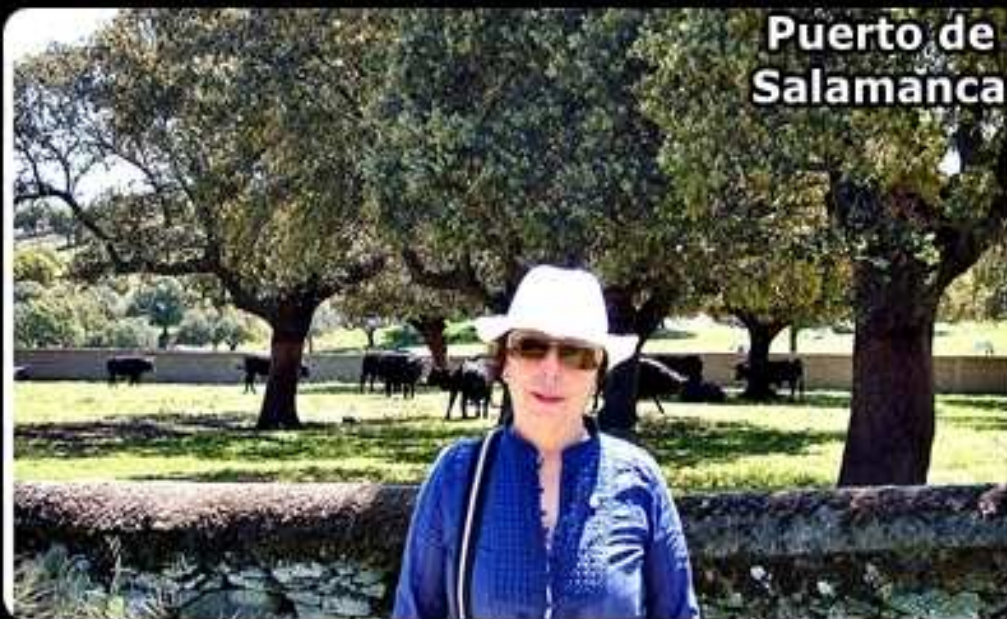
Puerto de la Calderilla Salamanca 22-05-2010